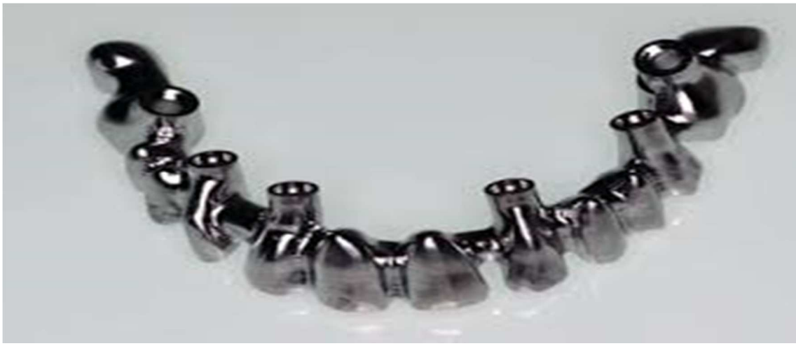
POLISSAGE MÉCANISÉ DE LA STRUCTURE EN TITANE