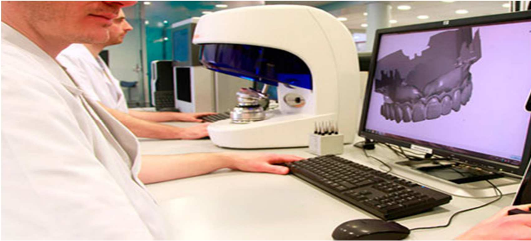
SCANNAGE ET DESIGN DE LA STRUCTURE