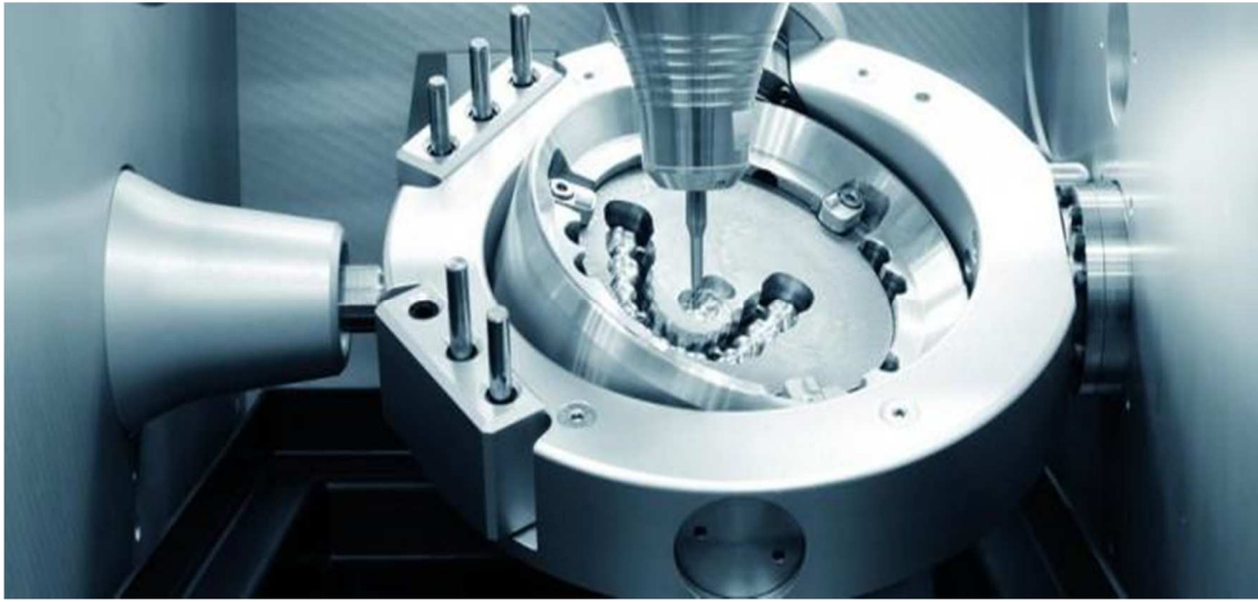
FRAISAGE DE LA STRUCTURE EN TITANE